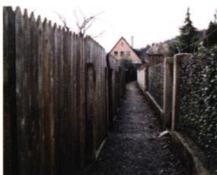
a Traboule entre terrains privés et jardins familiaux

Les Coteaux constituent, dans le sentiment des Obernois, un patrimoine paysager devant rester de l'usage de tous : appropriation par le regard d'un paysage commun et usage de cet espace par la fréquentation des promenades piétonnes le long des sentiers et l'accès à des points panoramas.