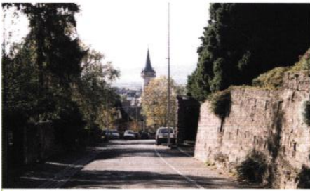
▲ Rue de la Montagne