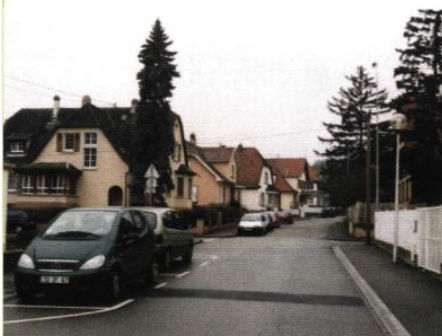
▲ Rue Mürner

Les maisons sont construites en retrait d'alignement selon des modèles architecturaux qui ont évolués suivant la période de leur réalisation. Cette diversité architecturale relative est très peu perceptible au regard de la forte unité donnée au quartier par le dispositif de clôture des parcelles et l'importante végétalisation de celles-ci.