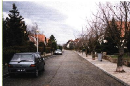
▲ Rue du Vignoble

L'ambiance de ses espaces publics est donnée par la qualité des aménagements paysagers : alignement d'arbres le long des rues, sentier viticole arboré formant limite entre terrains bâtis et vignoble.