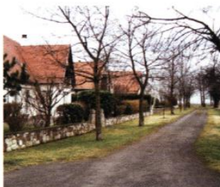
b Sentier arboré entre terrains privés et vignoble