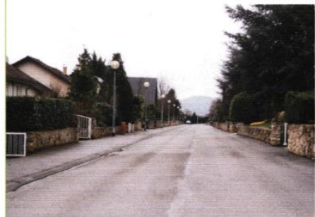
▼ Rue des Bosquets