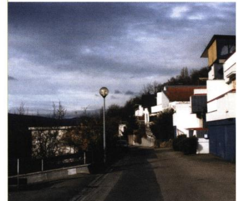
▼ Rue de la Moyenne Corniche

Depuis les années 1970, s'oppose à cette urbanisation maîtrisée, le développement d'un habitat dispersé le long de la rue de la Moyenne Corniche, et dans le prolongement de la rue de la Montagne et de la route de Boersch. Cette urbanisation "au coup par coup" mêle à la construction de maisons individuelles, la réalisation d'immeubles collectifs. A l'absence de maîtrise urbaine s'ajoute une liberté architecturale qui conduisent à fabriquer sur le versant le plus exposé aux regards, une image relativement chaotique.