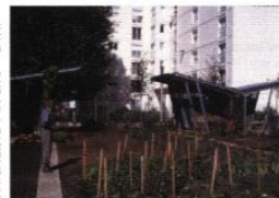
PAYSAGISTE : IN SITU - D.R.

◀ Au pied des immeubles, l'aménagement végétal accompagne vers les logements et crée, depuis les fenêtres des appartements, un paysage proche et protecteur.