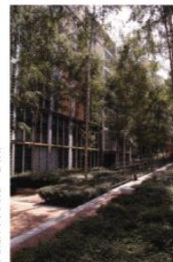
ARCH : PIANO

◀ Les petits aménagements (haies, claustras, pergolas, abris, ...) délimitent les cheminements et hiérarchisent les espaces collectifs et privés.