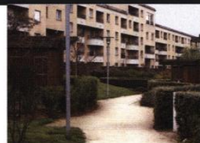
PAYSAGISTE : SIMON - D.R.

L'embellissement des espaces verts est aussi l'occasion d'améliorer ou de transformer les usages ou la configuration des lieux: mieux distinguer les espaces d'agrément et les cheminements, réorganiser le stationnement, donner de nouvelles hiérarchies entre espaces collectifs, espaces privés ou semi-privés, enrichir le parcours d'entrée vers les logements, intégrer des besoins particuliers (locaux poubelles, garages individuels ou collectifs, etc).