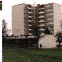
▲ Tour des bosquets