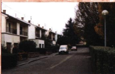
Square Saint Charles ▲

L'entrée de la maison s'effectue par une courrette de service, agrémentée de parterres ou de plantes en pots. Un auvent permet de garer la voiture, ranger le vélo ou la poubelle. Le jardin, abrité des regards se développe à l'arrière de la maison.