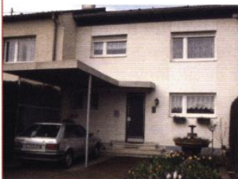
Rue des Bruyères ▲

Néanmoins, elles ne disposent pas de possibilité de modification ou d'adjonction importantes, pour un garage ou des pièces d'habitation par exemple. Chaque maison participe à un tout, unitaire et bien organisé : les façades obéissent à des traitements communs à l'ensemble ; le traitement végétal des espaces extérieurs (clôtures végétales basses, jardin d'agrément, potager, ...) personnalise chaque maison et diversifie le paysage de la rue.