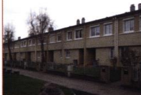
Place de Gail ▼

L'aménagement des jardins comporte une végétation riche (arbres à haute tige, arbustes à fleurs, plantes persistantes,...) qui profite à l'ambiance de la rue.