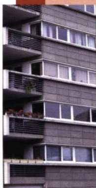
ARCH : LION

Une amélioration du confort phonique et thermique des appartements conduit souvent à fabriquer une seconde peau à l'avant des façades anciennes. Ces travaux peuvent être l'occasion de mener un projet plus global sur la qualité des logements: en modifiant des percements, en intégrant des prolongements extérieurs nouveaux, en apportant un traitement solaire, en restructurant les circulations communes ou en apportant une pièce en plus.