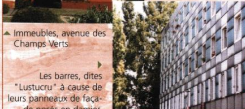
▲ Immeubles, avenue des Champs Verts

Les barres, dites "Lustucru" à cause de leurs panneaux de façade posés en damier, figurent parmi les premiers immeubles construits sur le secteur d'Europe Nord. Elles ont été réalisées selon les principes de standardisation radicaux, qui ont fait d'elles des objets singuliers du quartier. La démolition de deux des trois immeubles existants permet d'engager aujourd'hui le secteur vers d'importantes mutations qui consolideront son ancrage dans la ville et amélioreront son environnement.