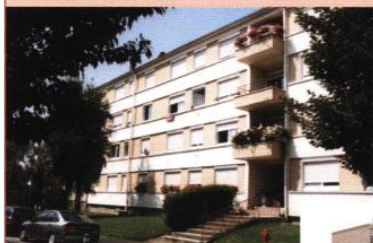
▲ Immeuble, boulevard de l'Europe

Le stationnement des résidents est géré soit par des boxes occupant le rez-de-chaussée des immeubles, soit par des boxes formant un bâtiment indépendant, soit sur les aires extérieures : généralement mal traité, il handicape la qualité des espaces extérieurs.