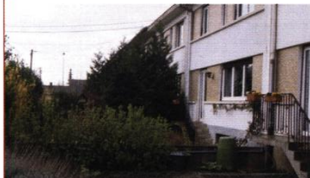
Rue des petits Champs ▼

Une annexe s'implante sur rue : elle comporte l'atelier et le garage et sert de porche d'entrée. A l'arrière, un jardin patio donne accès à l'habitation proprement dite. Lorsque le patio comporte un arbre, celui-ci agrémente le paysage du quartier et rompt la monotonie des habitations accolées. Le potager est situé de l'autre côté de la maison. Avec les jardins voisins, il forme un paysage commun : ne le cloisonnez pas par des haies trop denses, conservez par endroit des transparences.