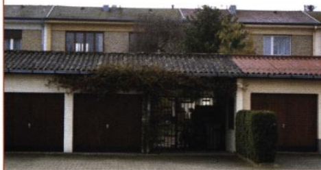
Les maisons suédoises ▲

Une annexe s'implante sur rue : elle comporte l'atelier et le garage et sert de porche d'entrée. A l'arrière, un jardin patio donne accès à l'habitation proprement dite. Lorsque le patio comporte un arbre, celui-ci agrémente le paysage du quartier et rompt la monotonie des habitations accolées. Le potager est situé de l'autre côté de la maison. Avec les jardins voisins, il forme un paysage commun : ne le cloisonnez pas par des haies trop denses, conservez par endroit des transparences.