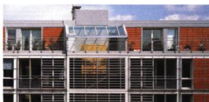
ARCH : PIANO - D.R.

▲ la façade s'organise par le jeu entre les panneaux de remplissage et les éléments filants, en saillies.