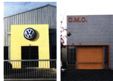
▲ L'enseigne donne le nom de l'entreprise et dialogue avec l'architecture du bâtiment. Exemples de positionnements stratégiques.

En général, une seule enseigne par façade: le nom de l'entreprise et sa qualification ou son domaine d'exercice. Les enseignes à vocation publicitaire sur les produits commercialisés par l'entreprise sont à proscrire.