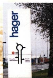
Le totem est une réponse adaptée à la signalétique sur espace extérieur

La signalétique implantée sur l'espace extérieur Elle doit être considérée comme un élément de l'aménagement des espaces extérieurs ou de la clôture et s'implante en relation avec eux.