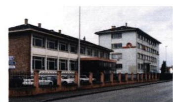
activités tertiaires et industrielles