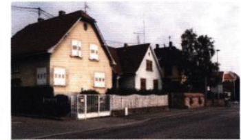
maisons de faubourg

Le mélange du logement et de l'activité industrielle, la variété des typologies bâties constituent une mixité fonctionnelle, que viennent encore renforcer le supermarché et les deux cimetières. Favorable à l'animation urbaine, cette mixité génère cependant des rapports brutaux entre programmes de nature différente. Rudesse urbaine encore aggravée par le caractère routier et minéral de la rue du Gal Leclerc.