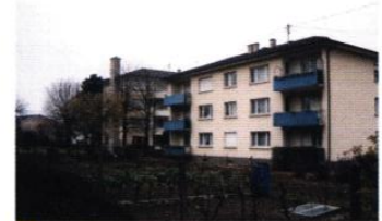
immeubles collectifs 1970