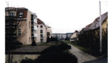
immeubles collectifs 1980-90