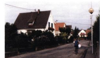
quartier de la loi 1960