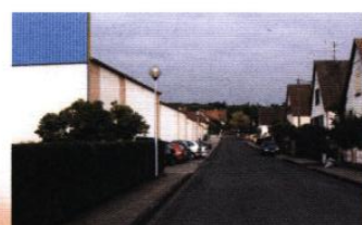
◀ Rue du Génie : rapport brutal entre habitat et activité industrielle

FÉDÉRER LES DIVERSITÉS PAR UNE ARMATURE VÉGÉTALE