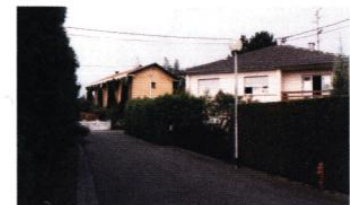
lotissement Les Eglantines 1970